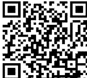
華語中心官方 Line 帳號